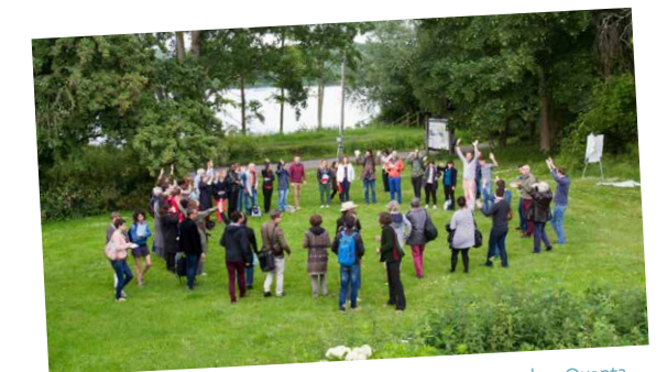
La journée-ressources de juin 2019 s'est déroulée au vert chez Quanta

Nous continuons à débattre et à nous mettre en mouvement, acteurs, citoyens... Vous avez des idées pour alimenter le réseau ? Venez nous en parler !