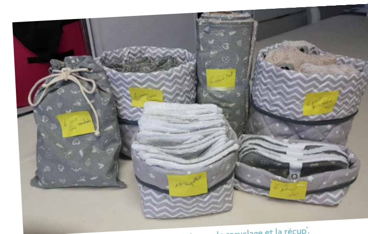
L'Union des Familles a réorienté ses activités vers le recyclage et la récup'.

L' Union des Familles , par exemple, a réorienté les activités de son atelier couture vers la réalisation de sacs et de lingettes réutilisables. Les bénévoles de son repair café ont souhaité être formés sur le thème de la transition écologique, et d'autres ont souhaité apprendre à créer des composteurs ou travailler de façon plus écologique sur les jardins.