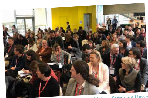
Rencontre "Osez l'ESS" organisée à la Maison Stéphane Hessel

Nous avons également initié une expérimentation sur le territoire de la Sambre Avesnois Thiérache (SAT), facilitant les rapprochements entre les acteurs de l'ESS et les collectivités afin de