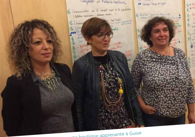
Un trio gagnant pour une boutique apprenante à Guise