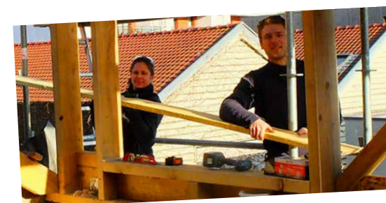
Auto-réhabilitation accompagnée avec Toerana Habitat.

Initié par l'Apes, un groupe de travail inter-collectivités a rassemblé des techniciens de Mons en Bel-