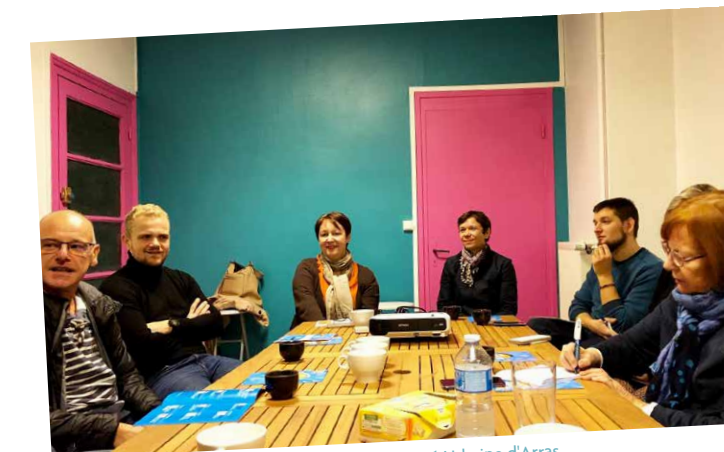
Rencontre entre élus et acteurs de la Communauté Urbaine d'Arras et du Boulonnais.

Sur ce territoire, l'Apes a joué son rôle de réseau régional en apportant des informations, des conseils et de l'accompagnement collectif ou individuel. D'autre part, elle a expérimenté une nouvelle manière d'intervenir : la mise en récit territoriale : des paroles d'acteurs ont été recueillies sur leur vision de la trajectoire du territoire. Il s'agit de révéler, poursuivre et améliorer ce qui fait sens collectivement dans la stratégie et les projets de développement local. Une dizaine d'interviews ont été menées, d'autres sont à venir. Une réflexion est engagée sur une boîte à outils permettant d'en partager les enseignements avec les autres territoires en région. Récit à suivre !