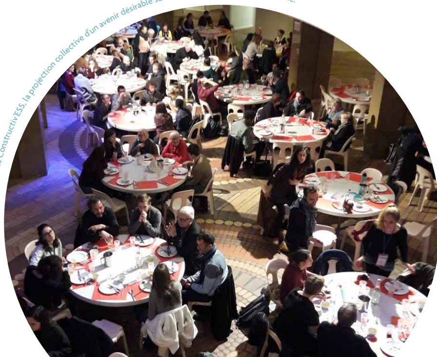
Les Constructiv'ESS, la projection collective d'un avenir désirable sur les territoires des Hauts-de-France.

L'Apes a participé à la construction de l'appel à projets ESS avec la collectivité et en coopération avec les acteurs. Elle a pu apporter son regard averti, riche de sa participation à de nombreux jurys dans le cadre d'appels à projet en place sur les différents territoires de la région. Par ailleurs, elle s'est appuyée sur sa charte de l'économie solidaire qui explicite les valeurs et les pratiques attendues au sein des projets et des organisations de l'ESS. Elle a également suivi les réunions du comité d'animation du Bassin minier et a participé au Forum ESS à la Maison des projets de Lens. Autant d'occasions de constater la force de la dynamique locale. À noter, une maison de l'ESS est en projet !