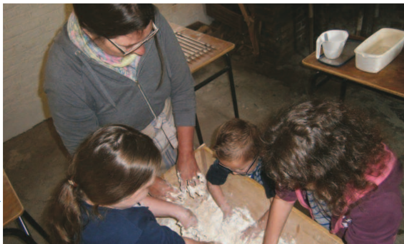
A l'atelier pizzas, on met la main à la pâte !

paysans soucieux du respect de l'humain et de l'environnement, des chercheurs et des animateurs issus des milieux d'éducation populaire. De ces réflexions naît l'association Accueil Paysan en Isère, qui se dote d'une charte et essaime progressivement dans toute la France. Elle a pour projet de faire découvrir au public les réalités du milieu paysan, dans un souci d'ouverture et d'échange, tout en fournissant un revenu complémentaire aux agriculteurs.